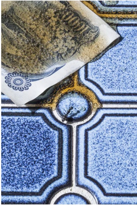
大野真人，SEPARATE HIDDEN RULES，2016