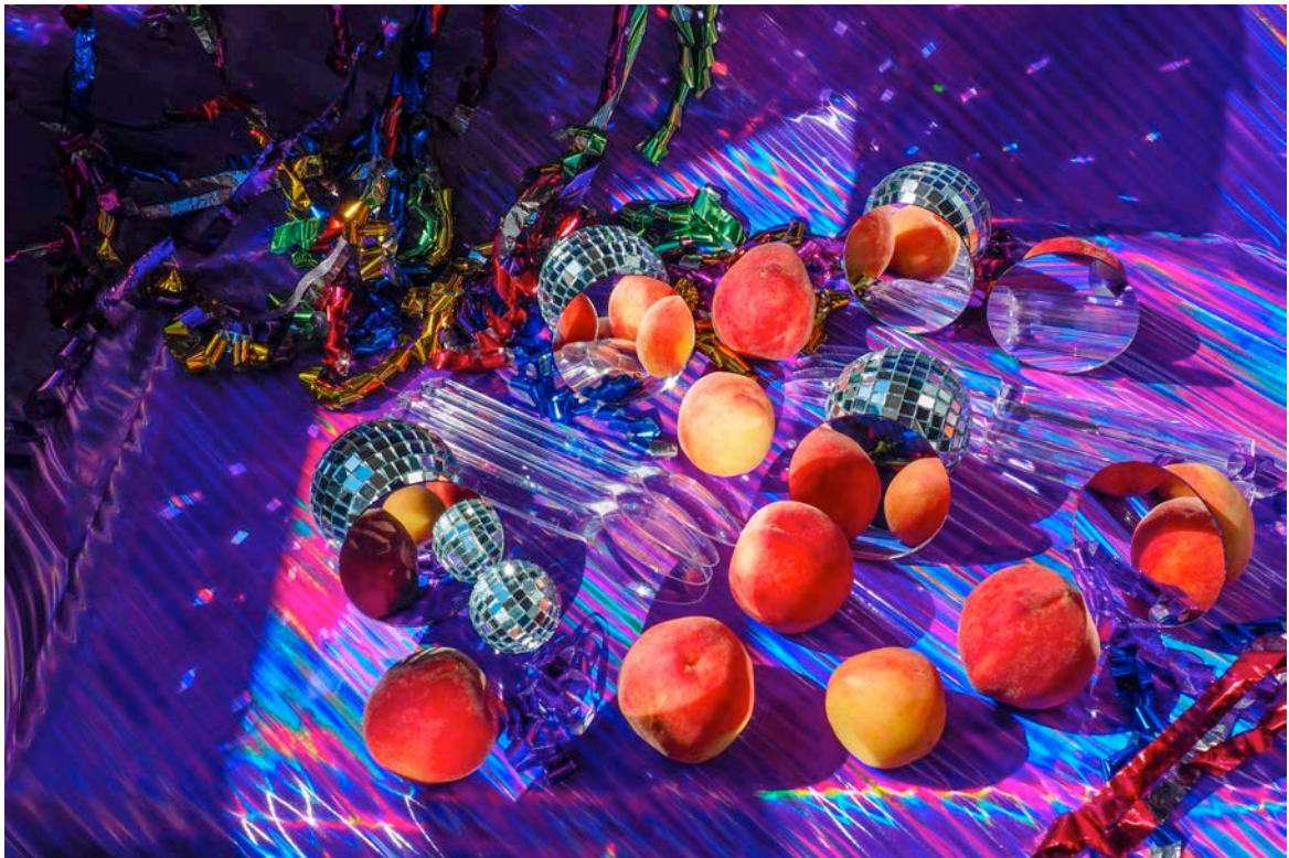
吳美琪，XYX - A Moveable Feast #1-2，2017