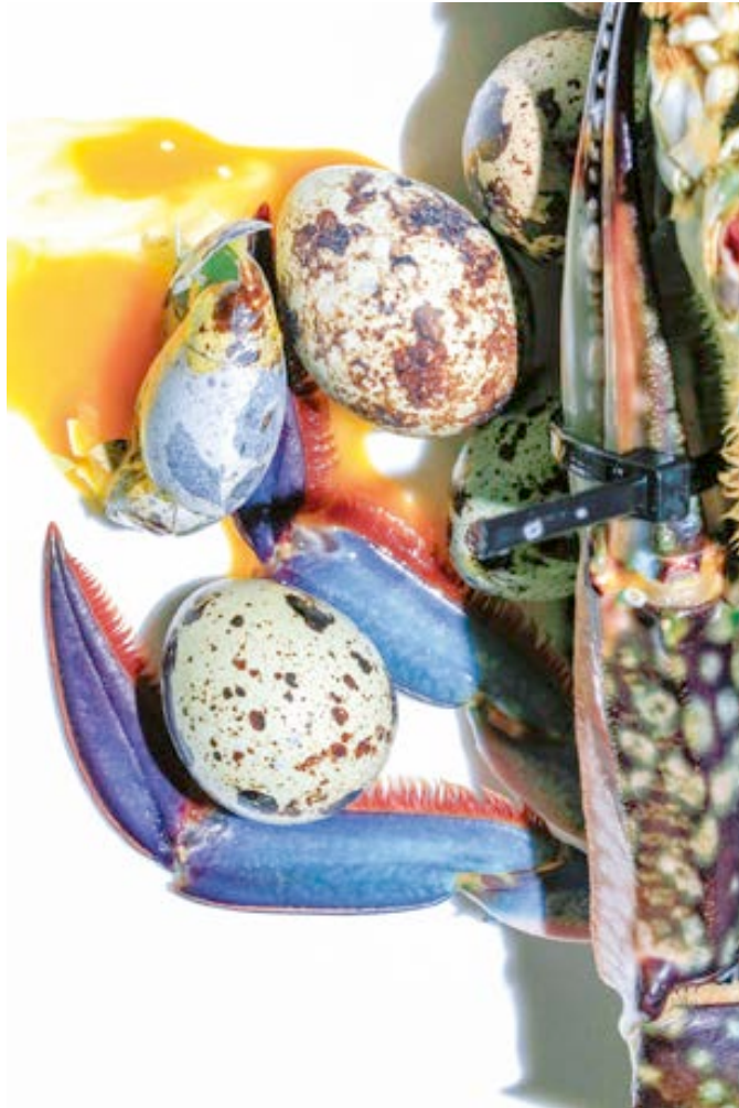
大野真人，SEPARATE HIDDEN RULES，2016